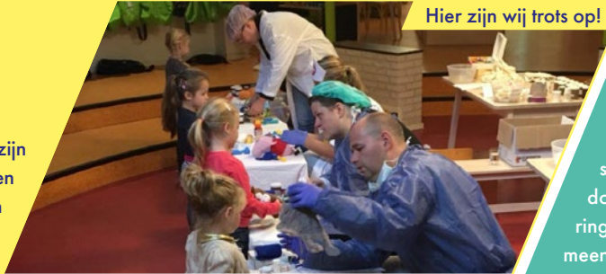
Hier zijn wij trots op!

We stralen en schitteren en zijn trots op onszelf. We hebben het lief veranderingen aan te gaan en grenzen te verleggen. We vieren mijlpalen, delen momenten en creëren herinneringen. We zien uit naar de toekomst en hebben plezier in ons werk.