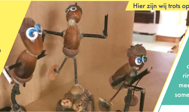
Hier zijn wij trots op!

Trots, dat zijn de kinderen. Ze etaleren de werkjes die ze hebben gemaakt. Om aan papa en mama te laten zien. Ze geven elkaar complimentjes tijdens een stille dialoog. Gewoon schitterend!