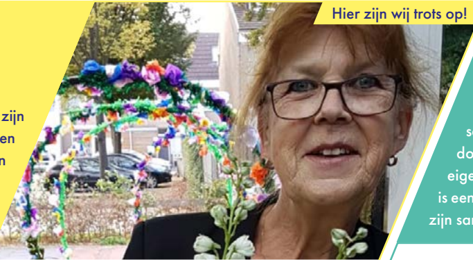
Hier zijn wij trots op!