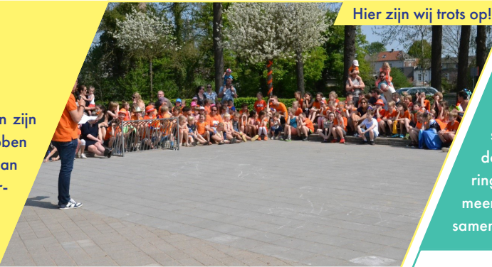
Hier zijn wij trots op!

We stralen en schitteren en zijn trots op onszelf. We hebben het lef veranderingen aan te gaan en grenzen te verleggen. We vieren mijlpalen, delen momenten en creëren herinneringen. We zien uit naar de toekomst en hebben plezier in ons werk.