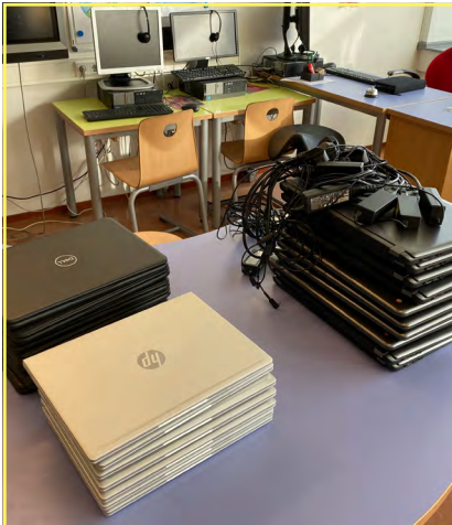
Online onderwijs is en blijft voor groot en klein intellectueel uitdagend.